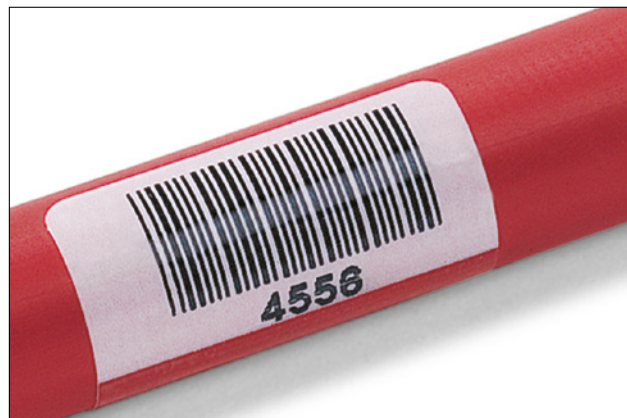
Laminering gir lang holdbarhet.