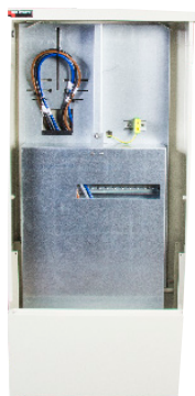
TKSA forberedt til 400V montering og med IP20 deksel

*Innhold: Komplett klemmer AL/CU 50 kvmm til IT/TT og TN.